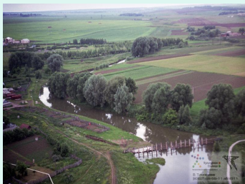
Тăван сĕр шыв